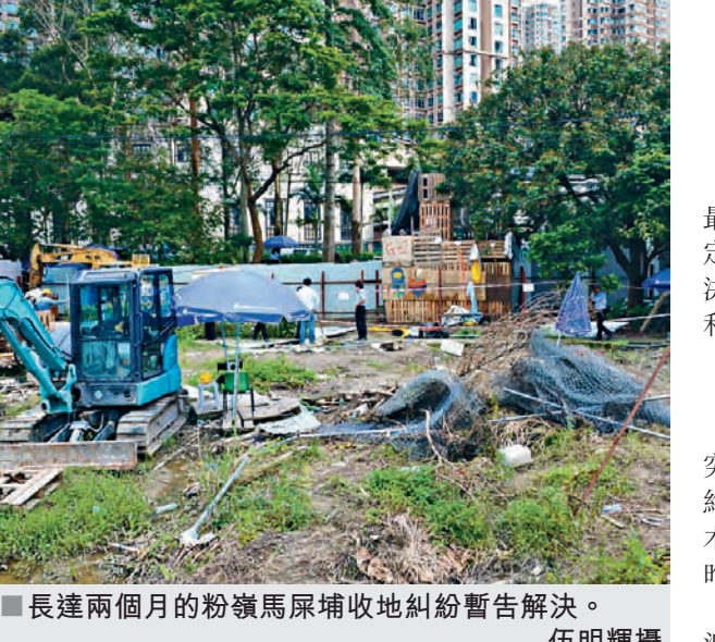
長達兩個月的粉嶺馬屎埔收地糾紛暫告解決。