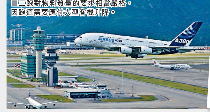
三跑對物料質量的要求相當嚴格，因跑道需要應付大型客機升降。