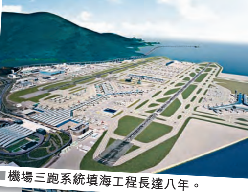
機場三跑系統填海工程長達八年。