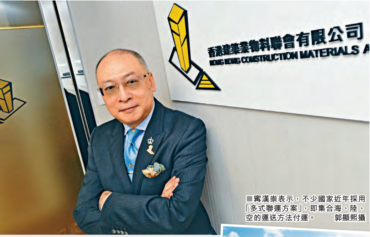
香港建築業物料聯合會有限公司 THE HONG KONG CONSTRUCTION MATERIALS ASSOCIATION

他又指出，除了機場三跑外，本港大型基建項目將在未來一兩年內相繼完成，料業界在三年後會重新集中資源興建房屋，以配合當局的建屋目標，相信預早檢視三跑項目所需的物料，也可確保未來房屋項目按計畫落成。